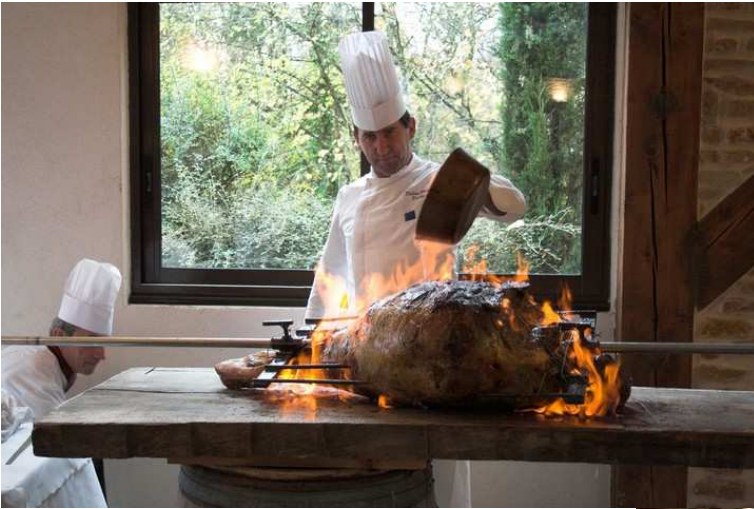
La cuisse de bœuf à la broche. Un spectacle pour les yeux et un ravissement pour le palais.

Malgré des conditions météo peu encourageantes pour les déplacements, 200 amicalistes ont bravé la neige et se sont retrouvés au Domaine des Oliviers aux Ponts Tarrets en Beaujolais.