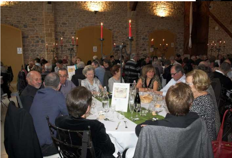
Quelques vues de la salle